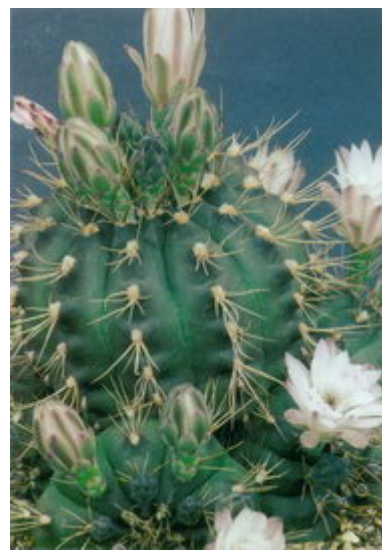
Figure 11 : Gymnocalycium anisitsii , une grosse touffe bien cultivée

G. altagraciense (Fig. 2), un nom provisoire publié par Bozsing dans le journal tchèque Kaktusy en 1981 qui n'a pas été validé pendant le quart de siècle suivant son apparition typographique. Il a par la suite été très largement commercialisé à partir de plantes issues de graines. La comparaison que Schutz en a faite avec G. leptanthemum l'a probablement jeté aux oubliettes où il est resté, bien qu'il y ait, je pense, toujours beaucoup de plantes étiquetées sous ce nom dans les collections. Si vous trouvez G. altagraciense vraiment différent, c'est une bonne raison pour conserver ce nom sur l'étiquette, en rajoutant peut-être l'abréviation fatidique nom. prov.